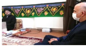
«اتاق فکر شورای فرهنگ عمومی» در لارستان راه اندازی می‌شود