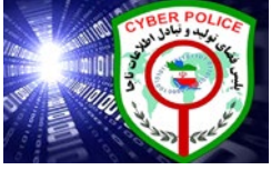
پلیس فتا: ثبت نام و فروش واکسن «آفلو آزا» در فضای مجازی ممنوع است