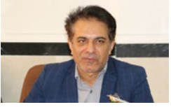
علی پور: ارتقای ادارات شهرستان اوز، با قوت ادامه می‌یابد