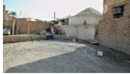
مراحل لایروبی آب انبار چهار برکه شهر لار