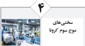
سختی‌های موج سوم کرونا