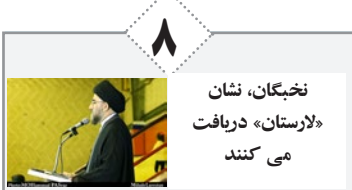
نخیکان، نشان «لارستان» دریافت می‌کنند