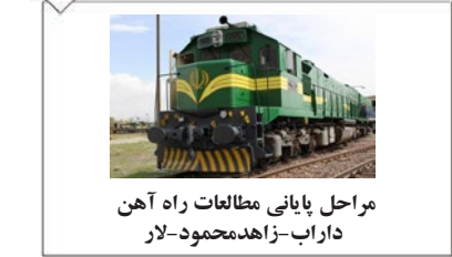
مرحله پایانی مطالعات راه آهن داراب-زاهد محمود-لار