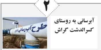
آبرسانی به روستای کمرالدشت گراش طرح آب رسانی