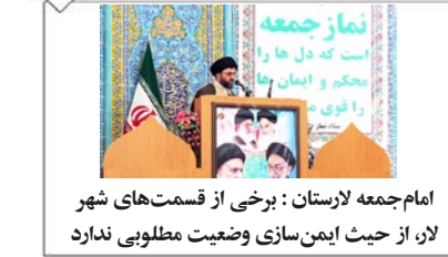
امام جمعه لارستان: برخی از قسمت‌های شهر لار، از حیث ایمن‌سازی وضعیت مطلوبی ندارد