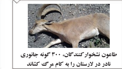
طاعون نشخوار کنندگان، ۳۰۰ گونه جانوری نادر در لارستان را به کام مرگ کشاند