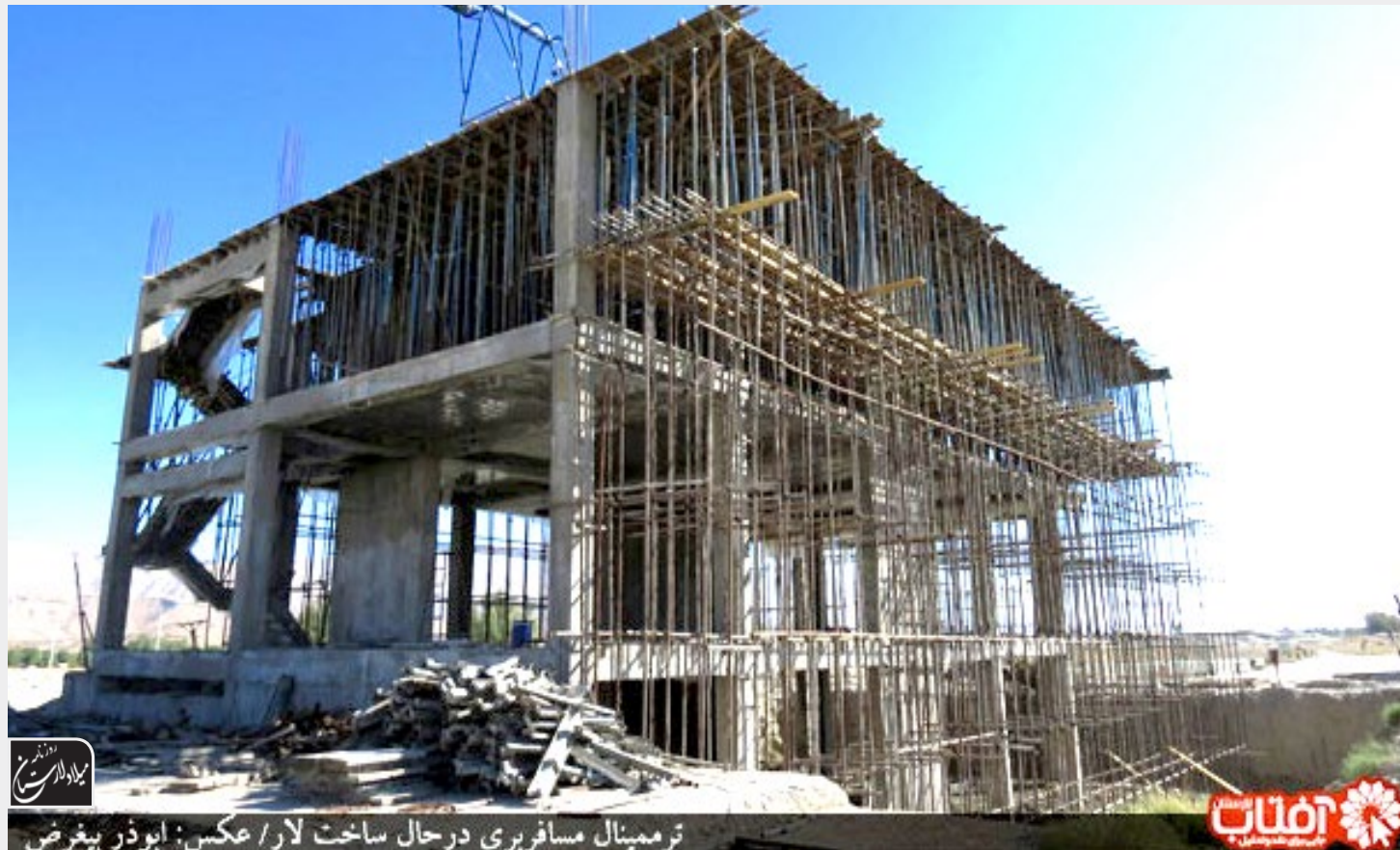
ترمینال مسافربری در حال ساخت لار