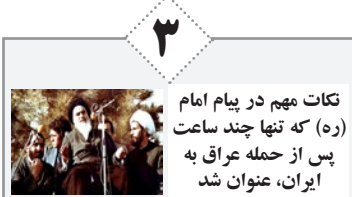
تکات مهم در پیام امام (ره) که تنها چند ساعت پس از حمله عراق به ایران، عنوان شد