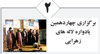
برگزاری چهاردهمین یادواره لاله های زهرایی