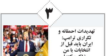
تهدیدات احتمالی و تکراری ترامپ: ایران باید قبل از انتخابات با من مذاکره کند!