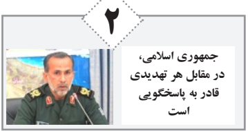
جمهوری اسلامی، در مقابل هر تهدیدی قادر به پاسخگویی است