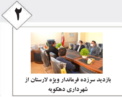
بازدید سرزده فرماندار ویژه لارستان از شهرداری دهکویه