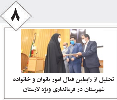
تجلیل از رابطین فعال امور بانوان و خانواده شهرستان در فرمانداری ویژه لارستان