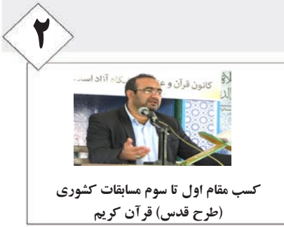
کسب مقام اول تا سوم مسابقات کشوری (طرح قدس) قرآن کریم