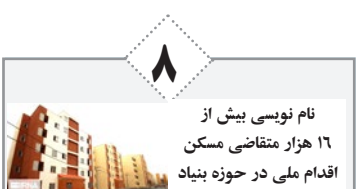
نام نویسی بیش از ۱۶ هزار متقاضی مسکن اقدام ملی در حوزه بنیاد مسکن فارس