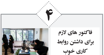
فاکتور های لازم برای داشتن روابط کاری خوب