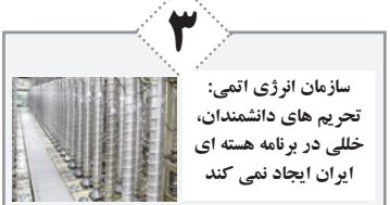
سازمان انرژی اتمی: تحریم های دانشمندان، خللی در برنامه هسته ای ایران ایجاد نمی کند