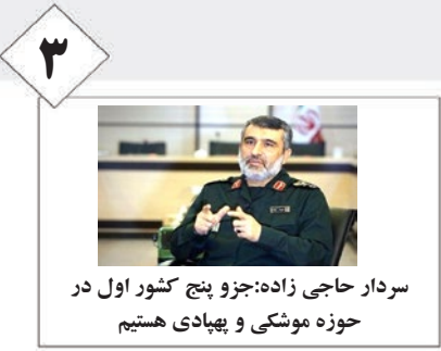
سردار حاجی زاده: جزو پنج کشور اول در حوزه موشکی و پهبادی هستیم