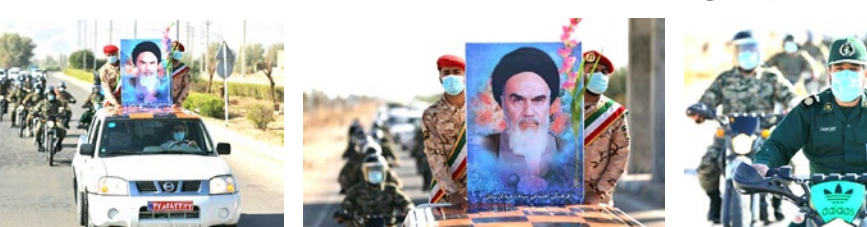
ادامه از صفحه اول

برومند افزود: این طرح مشتمل بر ۲۲ بلوک ۴ و ۶ واحدی با زیربنای ۹ هزار و ۶۲۴ مترمربع و ۹۶۰۰ مترمربع خیابان و فضای سبز و پارکینگ ساخته شده که هم اکنون در شرف تکمیل است.