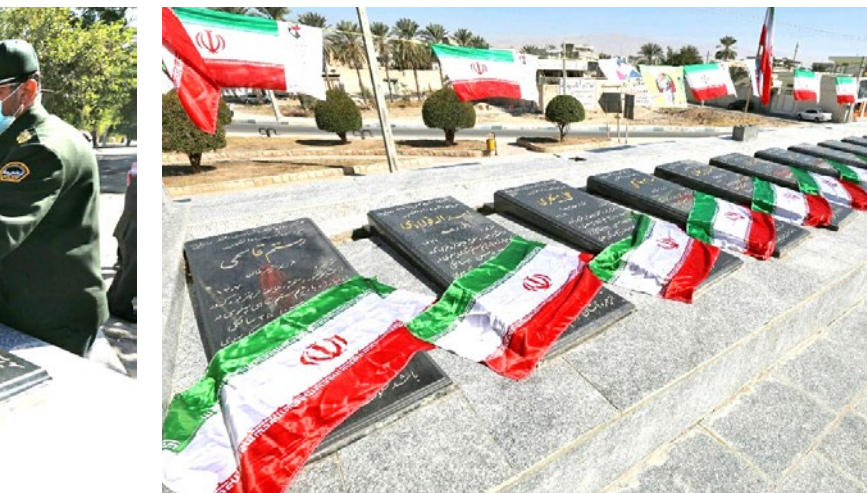
ادامه از صفحه اول

روز ۱۲ بهمن ماه سال ۱۳۵۷، امام خمینی(ره) پس از سال ها دوری و تبعید به کشور بازگشت.