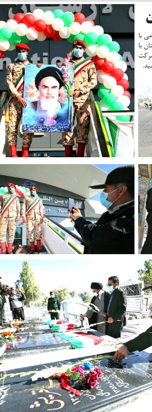
ادامه از صفحه اول

برگزاری آئین نمادین ورود امام خمینی(ره) به ایران اسلامی در لارستان