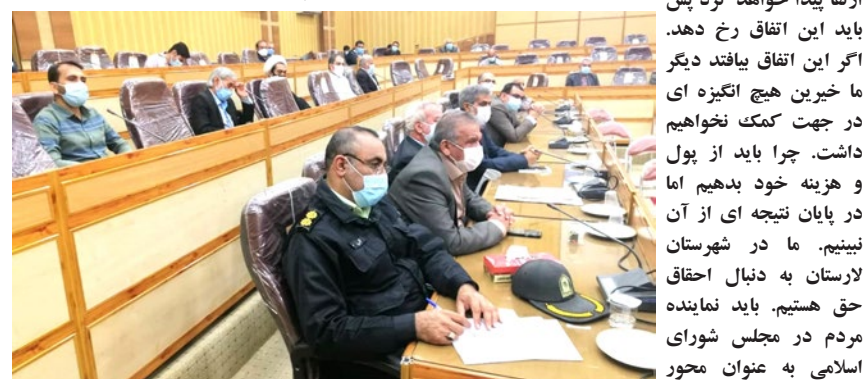
ادامه از صفحه اول

این اتفاق باید از لار رخ دهد. در بحث علمی کاربردی نیز بنظر سر مردم لار کلاه گذاشتند و در حالیکه بیان شد انحلال دانشگاه علمی کاربردی به ارتقا مجتمع آموزش عالی منجر خواهد شد اما این اتفاق که نیافتاد در کنار آن زمزمه تنزل مجتمع نیز در حال صورت گرفتن است. چرا نماینده مردم در مجلس شورای اسلامی با اینکه چند ماه قبل نسبت به این خبر آگاه شد اما الان و با موضع گیری امام جمعه لارستان به فکر افتادند و توقع ما از نماینده مردم بیش از این است. نماینده شهرستان جهرم توانسته است حفظ دانشگاه جهرم را تثبیت کند اما نماینده شهرستان لارستان تازه به دنبال این موضوع است. این دغدغه ماست که اجازه نخواهیم داد کلاهی که در مورد تعطیلی دانشگاه علمی کاربردی بر سر مردم لارستان گذاشته شد، در مورد دانشگاه دولتی نیز اتفاق بیافتد. معتقدیم اگر آن اتفاق افتاد و گفته شد که مجتمع ارتقا پیدا خواهد کرد پس باید این اتفاق رخ دهد.