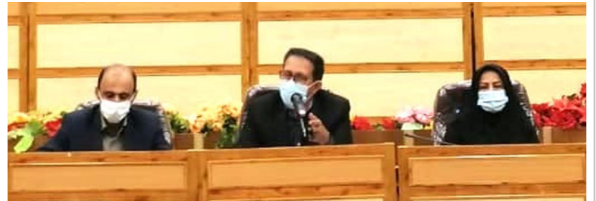
ادامه از صفحه اول

حسی، با اشاره به اینکه می توان گفت که باید رنگ غیرت برخی از افراد بومی ذی نفوذ در کشور فوران کند و در این قضیه وارد شده و ما را یاری رسانند، تأکید کرد: از طرفی این موضوع بحث ملی است و برخی دانشگاه های کشور را تعطیل یا تنزل داده اند ولی معتقدیم که برخی دستان به صورت غیر رسمی می توانند از قدرت چانه زنی خود بهره برده و در جهت عدم تنزل مجتمع قدم بردارند. وی با بیان اینکه از آنجا که طرح آمایش آموزش عالی یک طرح کشوری است از سوی وزارت علوم به فرمانداران و استانداران فشاری را در راه جلوگیری از این اقدام وارد نکنند، افزود: با این وجود بنا به دلایلی که مطرح کرده ایم ما معتقد هستیم که لارستان دارای ظرفیت های بالایی است و نسبت به خیلی از شهرستان های دیگر فرق می کند. معاون استاندار فارس، با تأکید