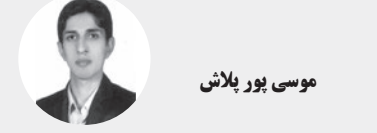
موسی پور بلاش

منزل رساند و جسم را به خاک. سیاهش کسرای برای چنین سرباز وطن قلم در دست می گیرد و به دنبال یک راوی می گردد و که باشد برتر از عمو نوروز که درد سالیان دراز ایران در مواجهه با توران را روایت کند!او از پس آن اندوه، شغف ایرانیان را در فرجام نیک یک تیر حکایت کند. همان عمو نوروز که در واپسین شب سال از پس کوه ها روانه می شد و خود را به آدم ها می رساند. اکنون در سرمای بی رحم چله، جفت کنده های نیمه سوخته در آتش، داستان جان برکفی آرش را برای نشتگان و منتظران می خواند، منتظران رفتن سرما. اندوه تنگی مرز و بی خبری هموطنان از یکدیگر و جدایی اقوام و تنگنای ایرانیان و پورش تورانیان برای عمو نوروز یادآور سرمای سخت است و جبر بی خیر بودن از حال هم در چله.شغف پیروزی نیز اگر چه با جان دادن آرش همراه است، اما یادآور نوروز و شکوفایی ست و دیدار دوباره مردم. شاید اگر این روایات ارزشمند را عمونوروز در روز عید برمی خواند، سرخوشی عید مانع تجسم اندوه و سختی ها میشد. اما مخاطب آنگاه که نشسته و طعم تلخ تنهایی و انتظار و تیغ سرما را احساس می کند به وضوح لمس خواهد کرد یادگار فداکاری های آرش های وطن را.