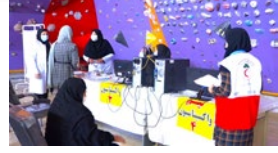
واکسینه شدن بیماران تالاسمی لارستان در برابر ویروس کرونا