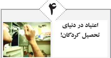
اعتیاد در دنیای تحصیل‌کردگان!