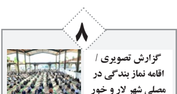
گزارش تصویری / اقامه نماز بندگی در مصلی شهر لار و خور