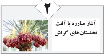
آغاز مبارزه با آفت نخلستان‌های گراش