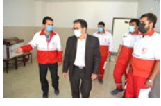
فرماندار لارستان: جنس مأموریت در هلال احمر، خدمت به مردم است