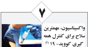
واکسیناسیون، مهمترین سلاح برای کنترل همه‌گیری کووید-۱۹