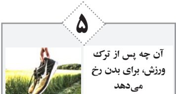
آن چه پس از ترک ورزش، برای بدن رخ می‌دهد