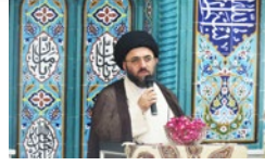
امام جمعه لارستان: وظیفه همه مردم مسلمان است که پای مردم فلسطین بایستند