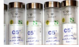
تولید محصول گران قیمت و ارزشمند کاندنسیت C+