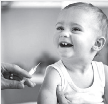
جدی گرفته و طبق برنامه انجام دهند. گفتنی است سرخک از جمله بیماری های واگیری بوده که سابق بر این ریشه کن شده به نحوی که وزارت بهداشت برای گزارش یک مورد ابتلا به سرخک جایزه تعیین کرد.