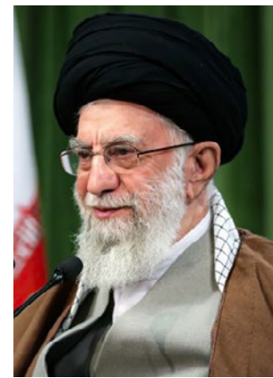
ادامه از صفحه اول

ایشان افزودند: توقع دیگر از کاندیداها این است که در صورت پیروزی، خود را به «عدالت اجتماعی»، «کاهش فاصله فقیر و غنی»، «مبارزه بدون ملاحظه با فساد»، «تقویت تولید داخلی و مبارزه با قاچاق و واردات بی‌رویه و افرادی که با پر کردن جیب خود از طریق واردات کمر تولید داخلی را می‌شکنند» متعهد بدانند. حضرت آیت‌الله خامنه‌ای تأکید کردند: کاندیداها صراحتاً درباره این موضوعات موضع بگیرند تا اگر بعد از انتخاب، عمل نکنند، دستگاه‌های نظارتی بتوانند از آنها سؤال و مؤاخذه کنند.