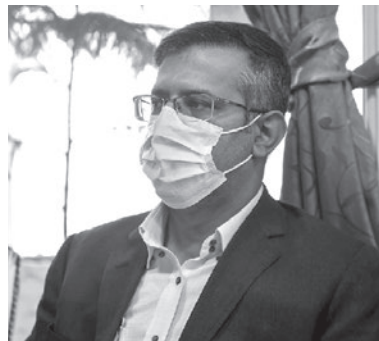
نماینده مردم لارستان، خنج، گراش و اوز در مجلس شورای اسلامی، گفت: من اعتقادی به جناح بندی سیاسی اصلاح طلب و اصولگرا ندارم، خدمت به مردم جناح بندی ندارد. به گزارش میلاد لارستان به نقل از خبرگزاری