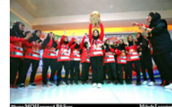
انتقاد کاپیتان سابق تیم ملی هندبال ایران از عدم حمایت از تیم هندبال بانوان لارستان