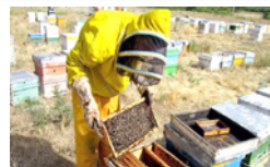
تاسیس شرکت تعاونی زنبورداران لارستان