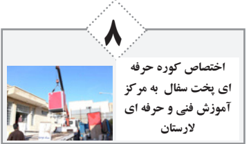
اختصاص کوره حرفه ای بخت سفال به مرکز آموزش فنی و حرفه ای لارستان