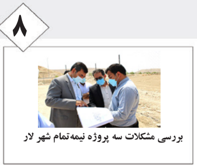
بررسی مشکلات سه پروژه نیمه‌تمام شهر لار