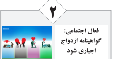
فعال اجتماعی: گواهینامه ازدواج اجباری شود