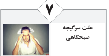
علت سرگیجه صبحگاهی