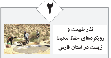
ندر طبیعت و رویکردهای حفظ محیط زیست در استان فارس