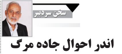
اندر احوال جاده مرگ

یارب ز بخت ماست که شد ناله بی اثر باهرگزاره و ناله وزاری اثر نداشت