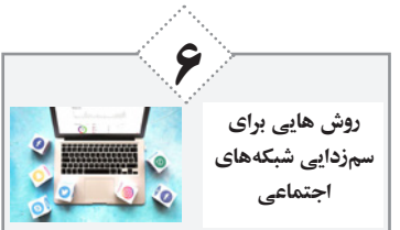
روش هایی برای سم‌زدایی شبکه‌های اجتماعی