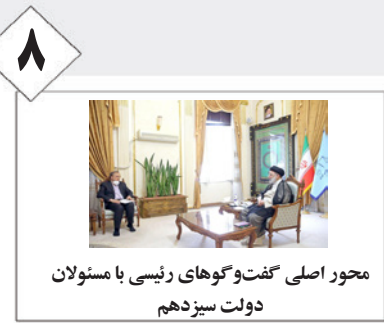
محور اصلی گفت‌وگوهای رئیسی با مسئولان دولت سیزدهم