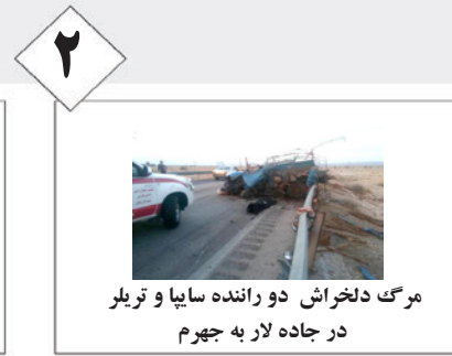
مرگ دلخراش دو راننده سایپا و تریلر در جاده لار به جهرم