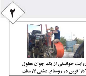
روایت خواندنی از یک جوان معلول کارآفرین در روستای دشتی لارستان