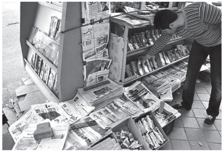
روزنامه‌نگاران در حال حاضر دستخوش تغییرات چشمگیر و چندوجهی شده است.

فناوری‌ها را ضروری می‌دانند. به همین دلیل مشتاق یادگیری بیشتر این فناوری‌ها هستند. اکنون روزنامه‌نگاران و کسانی که در این حوزه مشغول کارند، بیش از هر زمانی مشتاق استفاده از هوش مصنوعی شده‌اند. زیرا به این نتیجه رسیده‌اند که با استفاده از این فناوری می‌توانند هنگام مقابله با هر چالشی مانند کووید-۱۹ از عهده مشکلات ناشی از آن برآیند و میدان را خالی نگذارند.