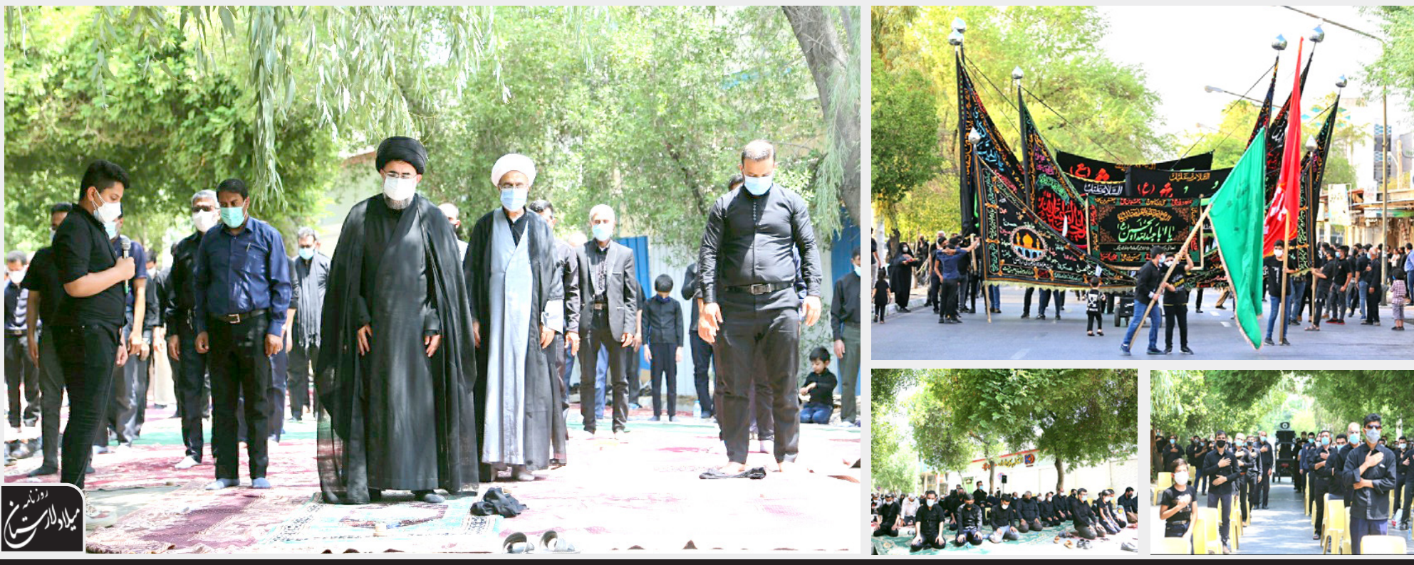
مراسم عزاداری سرور و سالار شهیدان حضرت اباعبدالله... الحسین (ع) و یارانش، با رعایت کامل پروتکل های بهداشتی، در کلیه مناطق لارستان برگزار شد