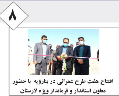
افتتاح هفت طرح عمرانی در بنارویه با حضور معاون استاندار و فرماندار ویژه لارستان