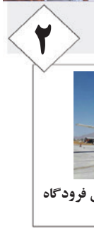
افزایش پروازهای داخلی و خارجی فرودگاه بین المللی لارستان