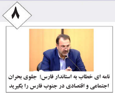
نامه ای خطاب به استاندار فارس؛ جلوی بحران اجتماعی و اقتصادی در جنوب فارس را بگیرد

روزنامه میلاد لارستان - سال بیست و نهم - شنبه ۰۶/۰۶/۱۴۰۰ - نوزدهم محرم الحرام ۱۴۴۳ - ۲۸ آگوست ۲۰۲۱ - شماره ۱۷۷۷ - ۸ صفحه - تک شماره ۳۰۰۰ تومان