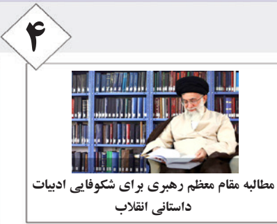
مطالبه مقام معظم رهبری برای شکوفایی ادبیات داستانی انقلاب