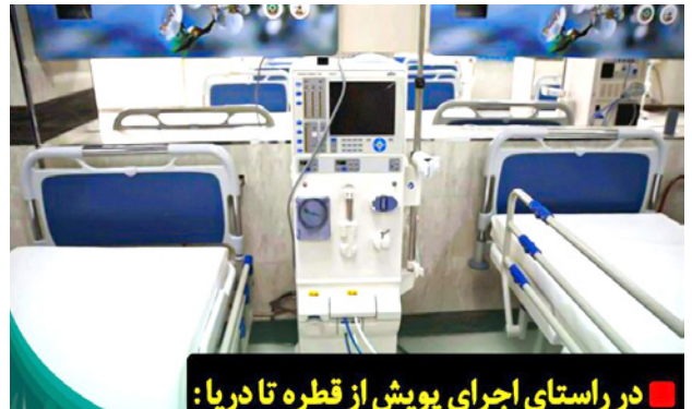
در راستای اجرای پوش از قطره تا دریا:

در راستای اجرای پوش از قطره تا دریا، یکی از جدیدترین دستگاه‌های دیالیز جهت بخش همو دیالیز بیمارستان امام رضا (ع) لارستان اهداء شد.