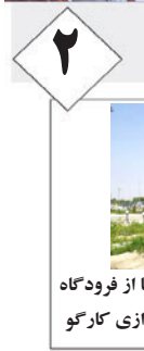
۲ برقراری مجدد پروازهای هواپیمایی هما از فرودگاه لارستان / آماده بودن زیرساخت راه اندازی کارگو