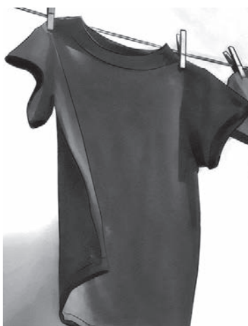
روشن استفاده کنید، رنگ آن‌ها قهوه‌ای خواهد شد، اما در پارچه‌های مشکی، فقط رنگ مشکی افزایش می‌یابد.

رنگ مشکی، از آن رنگ‌هایی است که می‌توان به راحتی با هر رنگ دیگری آن را تطابق داد؛ لباس مشکی، شلوار مشکی، پیراهن مشکی، از خرید آن سیر نمی‌شویم! اما نکته منفی آن این است که اغلب به سرعت بور می‌شود و پس از چند بار شستشو، به یک نوع خاکستری تیره تبدیل می‌شود که خب حیف است! اما خوشبختانه یک ترفند آسان و مقرون به صرفه برای رفع آن وجود دارد! نیازی به دور انداختن شلوارهای مشکی رنگ و رو رفته خود ندارید، ما یک ترفند بسیار ساده داریم که باعث می‌شود لباس‌های مشکی که رنگ شما در کوتاه‌ترین زمان به رنگ مشکی اولیه خود بازگردند. تنها چیزی که نیاز دارید دو فنجان قهوه سیاه، ماشین لباسشویی و لباس مشکی مورد نظر است.