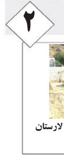
اجرای چهار طرح گاز رسانی در لارستان