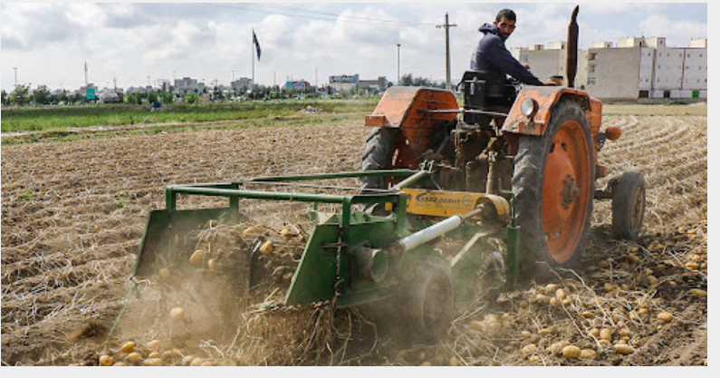
میلاد لارستان همین صفحه