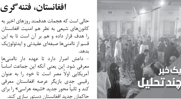
یک خبر چند تحلیل

داعش اصرار دارد تا عهده دار نامنی‌ها معرفی شود. این یعنی آنکه این جماعت اساساً آمریکایی‌اولا مصر است تا خود را به عنوان رقیبی جدی بازیگر عرصه افغانستان معرفی کند و ثانیاً محور جدید «شیعه‌هراسی» را برای حاکمان جدید افغانستان دستور سازی کند. گفته می‌شود طالبان اساساً با القاعده (دشمن آمریکا در افغانستان) سر ستیز ندارد و حتی می‌کوشد تا از این ظرفیت در زمان نیاز و در مقابل آمریکا بهره‌برداری کند در چنین شرایطی بدیهی است تقویت داعش از سوی آمریکا همچنان در دستور آمریکای اخراج شده از افغانستان قرار داشته باشد. به خاطر داشته باشیم در استراتژی آمریکاییان دشمن ایالات