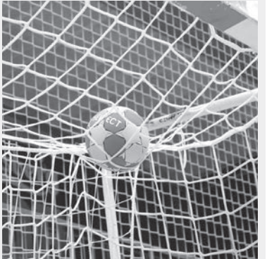
هیئت هندبال لارستان در ارزیابی عملکرد هیئت‌های هندبال استان فارس در سال ۱۳۹۹ توانست جایگاه دوم را به خود اختصاص دهد.

طبق جمع بندی و ارزشیابی های به عمل آمده نسبت به عملکرد هیئت های شهرستان ها در سال ۹۹ به ترتیب هیئت‌های هندبال کازرون، لارستان، جهرم، شیراز و فیروزآباد مقام‌های اول تا پنجم را کسب کردند.