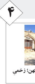
کاروان سرای «نوه» در لارستان کهن؛ زحمی بی مبری‌ها