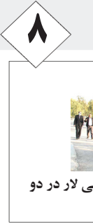
اجرای طرح احیای پارک جنگلی لار در دو بخش اجرایی

روزنامه میلاد لارستان - سال بیست و نهم - یکشنبه ۱۴/۰۹/۱۴۰۰ - بیست و نهم ربيع الثاني ۱۴۴۳ - ۰۵ دسامبر ۲۰۲۱ - شماره ۱۸۲۲ - ۸ صفحه - تک شماره ۳۰۰۰ تومان