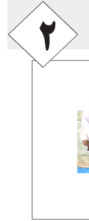
درخشش بانوان لارستانی در مسابقات کاراته آلمان