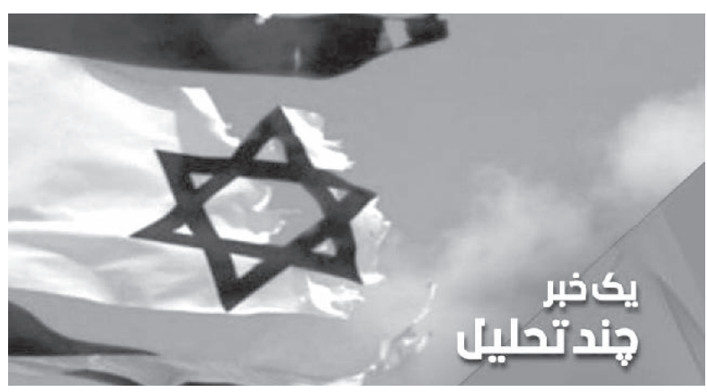
یک خبر چند تحلیل

با حضور در اذربایجان و البته امارات و بحرین بر این مساله تأکید کند که در کنار مرزهای زمینی و دریایی ایران حاضر است و... - علی رغم همه این تلاشها یک واقعیت مسلم وجود دارد و آن اینکه اسرائیل مدتهاست درمرزهایش توسط مقاومت منطقه محصور شده است و قد و قامت جمعیت ۶ میلیونی اش اساسا پاندازه ای نیست که کشوری مثل ایران و در نگاهی عالی تر جبهه مقاومت در منطقه را تهدید نظامی بکند. فراموش نکنیم تهدیدات نظامی اسرائیل علیه ایران حالا عمری بیش از ۴۰ سال پیدا کرده و البته هیچ گاه از سطح تهدید و لفاظی فراتر نرفته است. چشمگیر شدن این تهدیدات در این روزها حداقل فایده اش برای حکام اسرائیل می تواند اثرگذاری بر مذاکرات هسته ای پیش رو ازیکسو و حفاظت از کابینه بشدت لرزان اسرائیل از دیگر سو باشد.