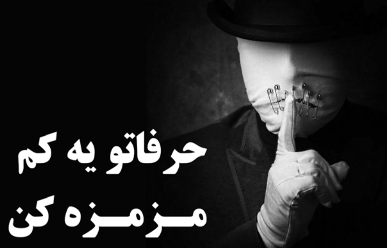
روش، درست مثل یک گلابیاتور، هر چند پیش می رویم، انگار به جایی که می خواهیم، چون همیشه یک احساس تنهایی و عدم