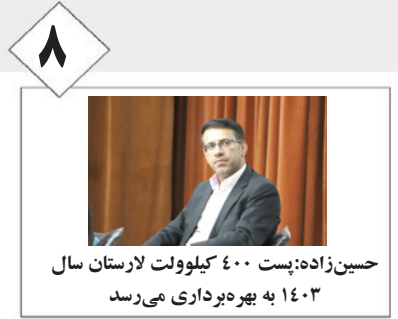
۸ حسین زاده: پست ۴۰۰ کیلوولت لارستان سال ۱۴۰۳ به بهره‌برداری می‌رسد