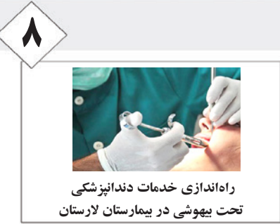
۸ راهاندازی خدمات دندانپزشکی تحت بیهوشی در بیمارستان لارستان