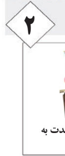
۲ برگزاری سومین نشست شورای وحدت به میزبانی اوز