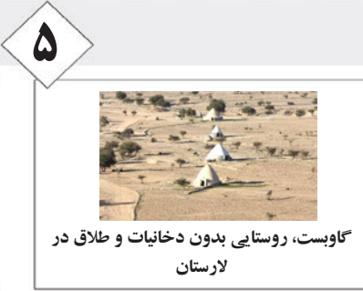
۵ گاوبست، روستایی بدون دخانیات و طلاق در لارستان