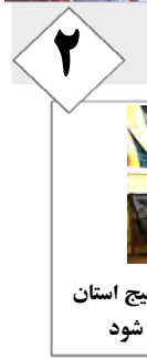
اولین پایگاه استعدادیابی کشتی بسج استان فارس به نام لارستان ثبت می شود