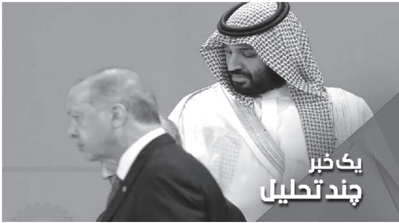
یک خبر چند تحلیل

خبر: وال استریت ژورنال از تلاش قطر برای میانجیگری میان بن سلمان و اردوغان خبر داده است.