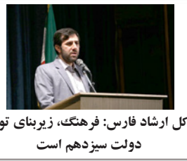
مدیرکل ارشاد فارس: فرهنگ، زیربنای توسعه در دولت سیزدهم است