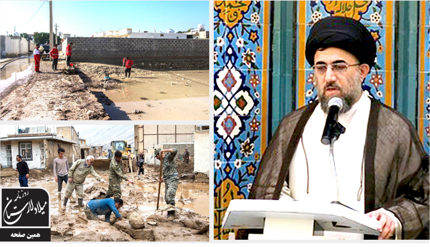
میلاد لارستان همین صفحه