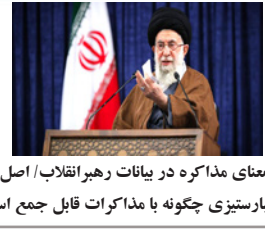
معنای مذاکره در بیانات رهبر انقلاب/ اصل استکبارستیزی چگونه با مذاکرات قابل جمع است؟