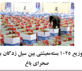
توزیع ۱۰۲۵ بسته‌بسته بین سیل‌زدگان یرم و صحرای باغ