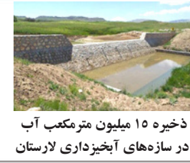
ذخیره ۱۵ میلیون مترمکعب آب در سازه‌های آبخیزداری لارستان