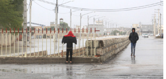
MiladeLarestan