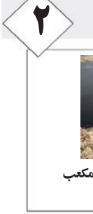
سد سلمان فارسی ۶۶۵ میلیون مترمکعب آب قابل استفاده دارد