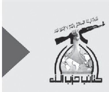
بزدلانه و تلاشی نفرت انگیز و شکست خورده برای هدف قرار دادن امنیت این کشور دانست.

مسئول امنیتی گردان های حزب... عراق در واکنش به حمله روز جمعه داعش به استان دیالی، خواستار «فشاری و مقابله با حامیان داعش در داخل کشور» شد. «ابوعلی العسکری» مسئول امنیتی گردان های حزب... عراق به حمله تروریست ها داعش در منطقه «العظیم» استان دیالی و کشته شدن ۱۱ نظامی عراقی، اعلام کرد که باید در برابر حامیان داعش در داخل کشور مقابله و آنها را رسوا کرد. به گزارش المیادین، العسکری افزود: مقابله با داعش مستلزم این است که پوزه سیاستمدارانی که در حمایت از داعش نقش دارند، به خاک