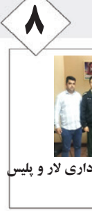
امضاء تقاهم نامه سایبری بین شهرداری لار و پلیس فتا لارستان