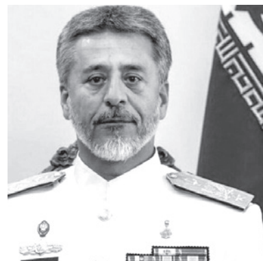
امیر دریادار سیاری گفت: قدرت های جهانی اقتدار و قدرت دریایی ایران را پذیرفته اند. امیر دریادار حبیبی... سیاری گفت: طبق بیان