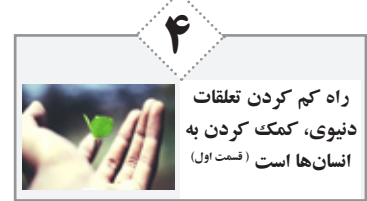
۴ راه کم کردن تفرقات دنیوی، کمک کردن به انسان‌ها است (مستوفی)