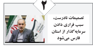
۲ تصمیمات نادرست، سبب فراری دادن سرمایه‌گذار از استان فارس می‌شود