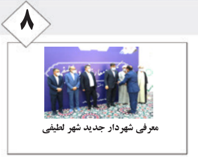
۸ معرفی شهردار جدید شهر لطیفی

روزنامه میلاد لارستان - سال سی ام - دوشنبه ۱۴۰۰ / ۱۲ / ۰۹ - بیست و ششم رجب المرجب ۱۴۴۳ - ۲۸ فوریه ۲۰۲۲ - شماره ۱۸۹۷ - صفحه ۸ - تک شماره ۳۰۰۰ تومان