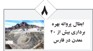
۸ ابطال پروانه بهره برداری بیش از ۲۰ معدن در فارس