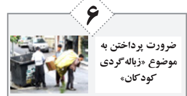
۶ ضرورت پرداختن به موضوع «زباله‌گردی کودکان»