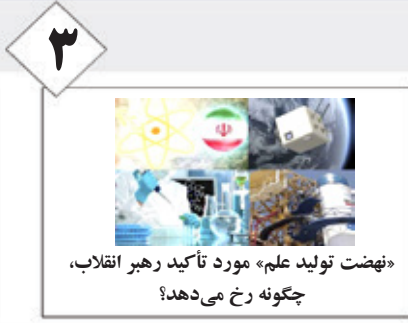
۳ «نهضت تولید علم» مورد تأکید رهبر انقلاب، چگونه رخ می‌دهد؟