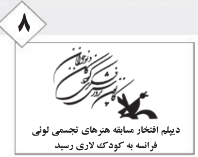
۸ دیلم افتخار مسابقه هنرهای تجسمی لوئی فرانسه به کودک لاری رسید