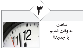
ساعت به وقت قدیم یا جدید؟