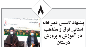
پیشنهاد تأسیس دبیرخانه استانی فرق و مذاهب در آموزش و پرورش لارستان