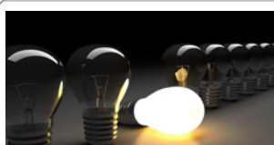
پاداش مشتریان کم مصرف برق چقدر است؟