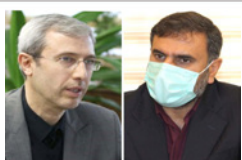
آکادمی بین‌المللی لارستان توسط فدراسیون تنیس روی میز ایران تجهیز می‌شود