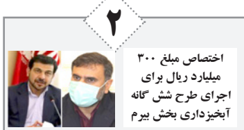
اختصاص مبلغ ۳۰۰ میلیارد ریال برای اجرای طرح شش گانه آبخیزداری بخش بیرم