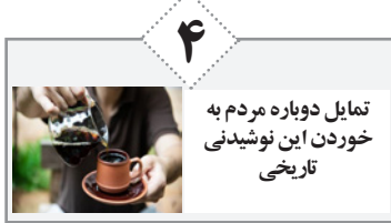
تمایل دوباره مردم به خوردن این نوشیدنی تاریخی