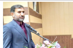
خط قرمز ما باید توسعه و پیشرفت لارستان باشد