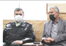
دیدار شهردار لار با فرماندهی جدید انتظامی لارستان