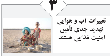
تغییرات آب و هوایی تهدید جدی تأمین امنیت غذایی هستند