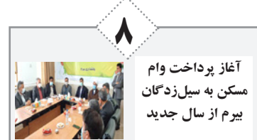
۸ آغاز پرداخت وام مسکن به سیزدهگان بیرم از سال جدید