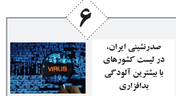
۶ صدرنشینی ایران، در لیست کشورهای با بیشترین آلودگی بدافزاری