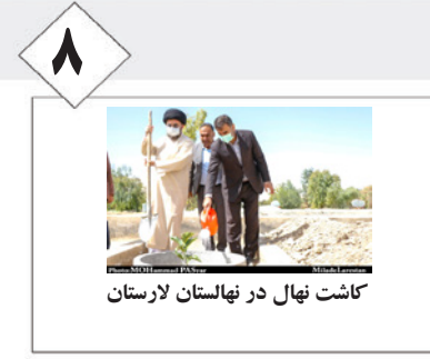
۸ کاشت نهال در نهالستان لارستان