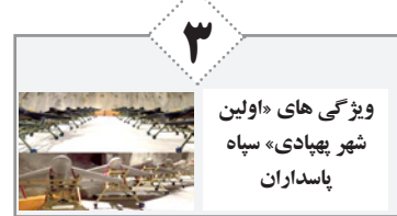
۳ ویژگی‌های «اولین شهر بهداشتی» سپاه پاسداران