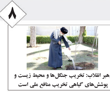
۸ رهبر انقلاب: تخریب جنگل‌ها و محیط زیست و پوشش‌های گیاهی تخریب منافع ملی است