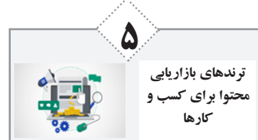
۵ ترندهای بازاریابی محتوا برای کسب و کارها