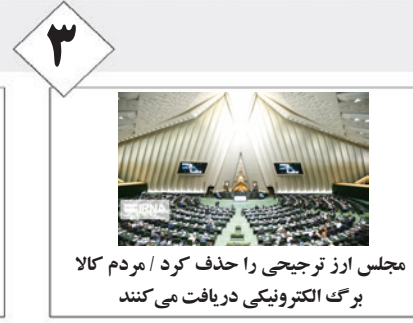
۳ مجلس ارز ترجیحی را حذف کرد / مردم کالا برگ الکترونیکی دریافت می‌کنند