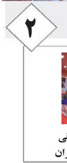
حضور دو پینک بنگ باز لارستانی در اردوی تیم ملی نوجوانان ایران