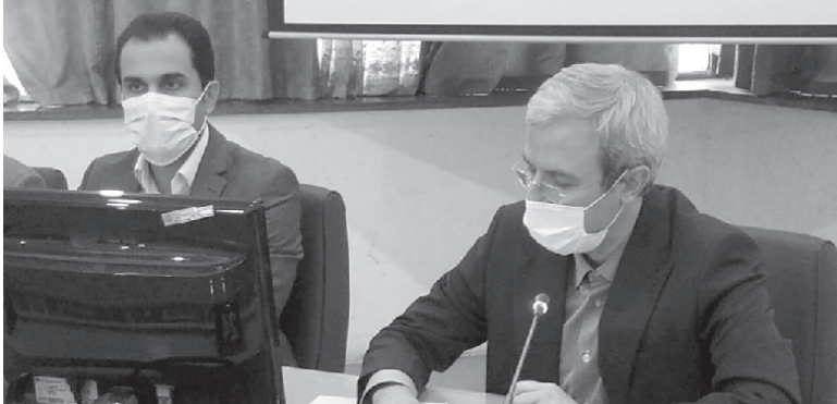
رئیس فدراسیون پینگ پنگ اعلام کرد: کسب عنوان پنجم در پیکارهای پینگ پنگ

وی ادامه داد: گاهی اوقات مردم چون قوانین را نمی دانند بد بین می شوند، ولی اگر شفاف سازی صورت بگیرد دیگر اعتراضی وجود نخواهد