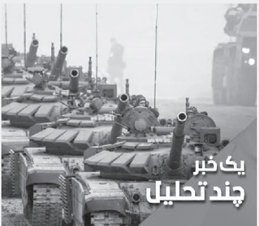
یک خبر چند تحلیلی

خبر: درحالی که بیش از ۵۰ روز از بحران اوکراین می گذرد و دورنمای روشنی برای آن متصور نیست، در آخرین اقدام گروه نظامی موسوم به «واکتش سریع» متشکل از آمریکا و چند کشور در دریای سرخ فعالیت خود را آغاز کرد. تحلیل: این-تشیکلات نظامی جدید در سایه بحران اوکراین روز چهارشنبه گذشته موجودیتش را اعلام کرد و از روز یکشنبه این هفته رسماً آغاز بکار کرد. به نظر می رسد در پشت این تصمیم چند هدف عمده تعقیب می شود. اول:صیانت ازبازار انرژی درسایه تهدیدات روسی که عمده‌توجه اروپاییهست. دوم: اعلام حمایت نانوشته از «هیات رهبری ریاست جمهوری یمن» که با کنار گذاشتن عبد ربه منصور هادی رییس جمهور مستعفی و فراری یمن بازیگردان سیاست های محورغربی، عربی، عبری در یمن شد و بالاخره هشدار به انصارا... یمن مبنی بر ضرورت مذاکره و کنار آمدن با هیات رهبری ریاست جمهوری به عنوان آخرین شانس برای برون رفت انتلاف ازبحران یمن. در-روزهای اولیه بحران، امارات در کمال تعجب در شورای امنیت به قطعنامه ای که روسیه را محکوم می کرد رای متعقد داد. البته با گذشت چند روز از این اقدام دلیل آن روشن شد که عبارت بود از جلب رضایت روسیه برای دادن رای مثبت به معرفی انصار... یمن به عنوان جنبشی تروریستی. در-همین راستا برخی کشورها با استفاده از فضای ناآرام بین المللی درسایه بحران اوکراین یاران فراموش شده دیروز خود یعنی النصره و برخی از دوعاش را احیا و در میدان اوکراین فعال کردند. ا-امریکا منتهای سعی خود را برای بسیج اروپا در پشت سرخود صورت داد و البته این امکان را پیدا کرد که برخی از کشورهای اروپایی که پیش از این از پیوستن به ناتو پرهنیز داشتند مانند سوئد و فنلاند را به این پیمان نزدیک کند.