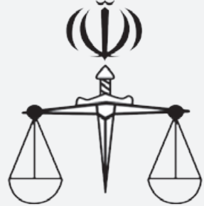
قوه قضائیه جمهوری اسلامی ایران

قوه قضاییه به عنوان یکی از قوای سه گانه حاکم در جمهوری اسلامی ایران است که برای اعمال وظایف و اختیارات خود از ساختار خاصی برخوردار بوده و مسئولیت های مختلفی را نیز بر عهده دارد.